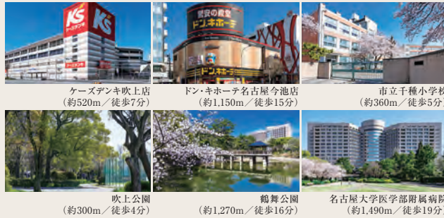
ケーズデンキ吹上店 (約520m / 徒歩7分) | ドン・キホーテ名古屋今池店 (約1.150m / 徒歩15分) | 市立千種小学校 (約360m / 徒歩5分) 吹上公園 (約300m / 徒歩4分) | 鶴舞公園 (約1.270m / 徒歩16分) | 名古屋大学医学部附属病院 (約1.490m / 徒歩19分)

スーパーマーケットはもちろん、カフェ、書店、ファッション、グルメなど多彩なショップが並ぶイオンタウン千種へ徒歩10分。吹上公園や鶴舞公園、教育施設や医療機関も身近で、都心を間近にしながら、落ち着きと充実した暮らしの豊かさを享受できる環境が広がっています。